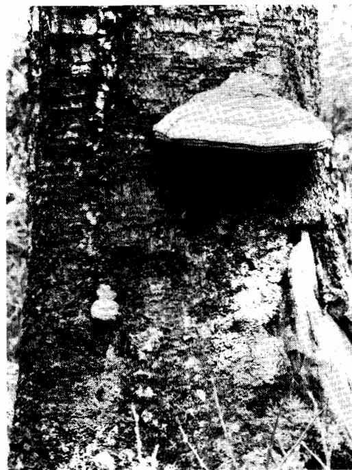
Fnösktickan, — Fomes fomentarius , — på död björk. En liten bryter fram nere till vänster på stammen.