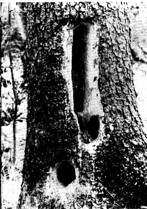
Typiska ätspår av spillkråka som hackat djupt genom frisk ved in till granens centrum för att komma åt hästmyror — Camponotus herculeanus .