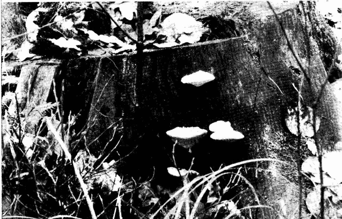
Tyromyces stipticus — bitterticka — på granstubbe.