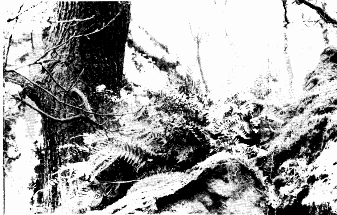
Stensöta på bergsbrant bredvid en av de talrika ekarna.